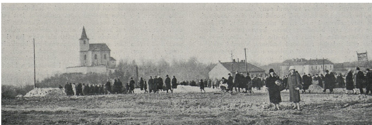
Příloha č. 5 – Matějská pouť v roce 1928