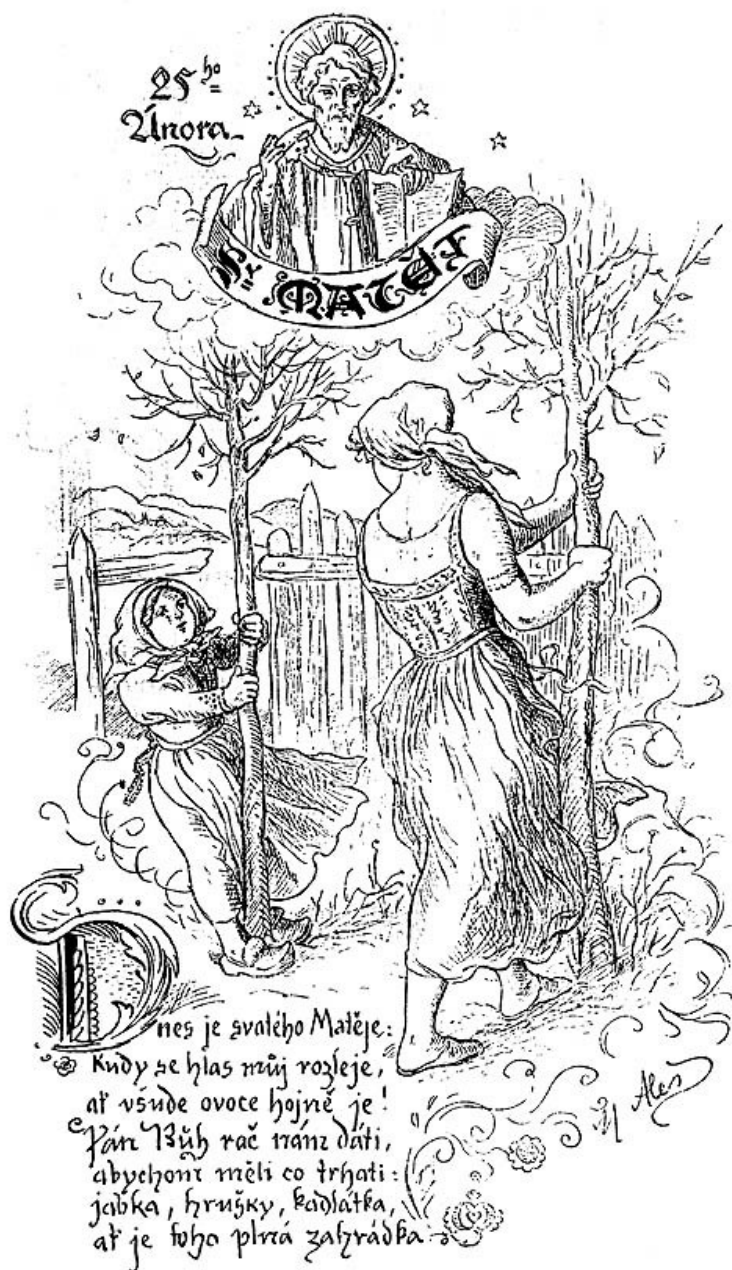
6. Příloha č. 1 – obrázek Mikoláše Aleše – Sv. Matěj