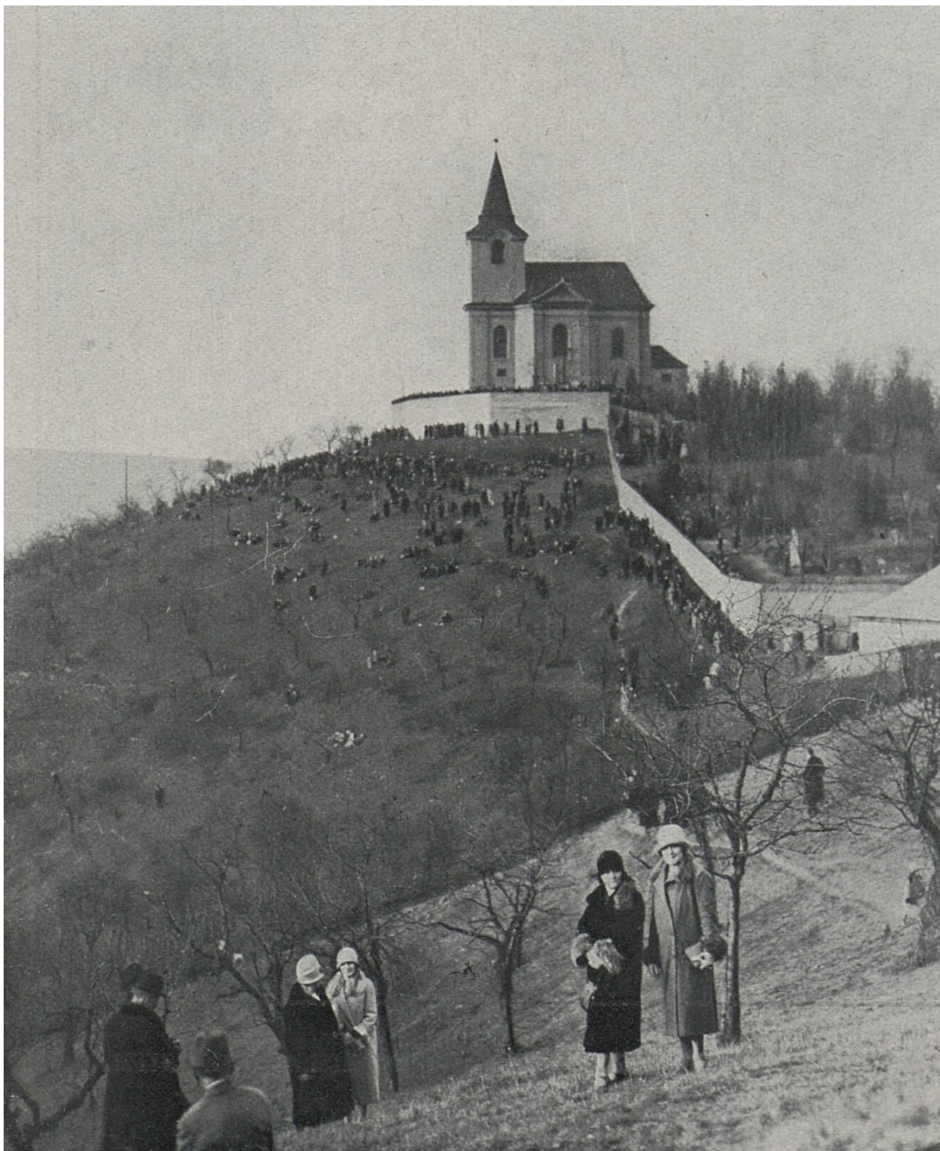
Příloha č. 4 – Matějská pouť v roce 1928