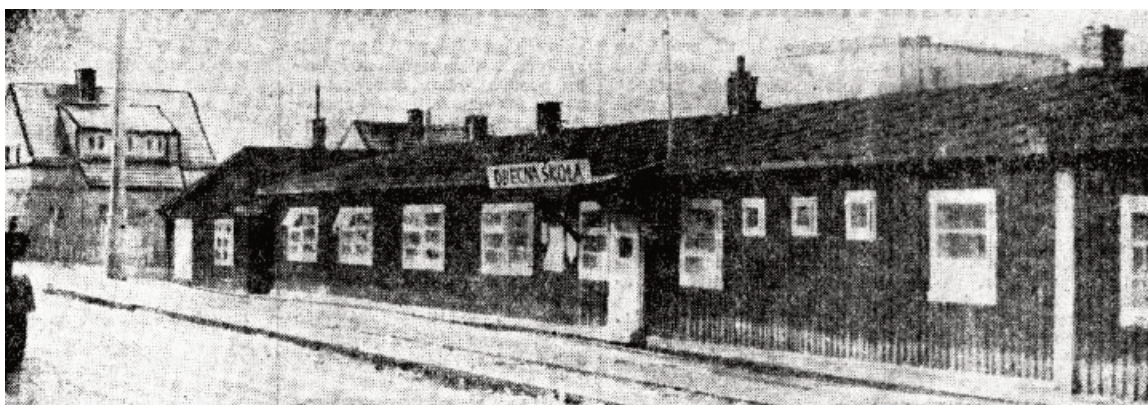
Obr. 6 Provizorní škola – pohled z jiné strany

Jak se škola se rozvíjela, žáků přibývalo. Došlo k výstavbě nové školní budovy a tím se rozšířil počet tříd na sedm. Příloha 1 obr. 1 a 2