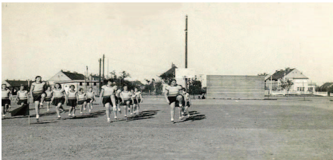
Obr. 4 Cvičení žáček v květnu 1938 na letním cvičišti (dnes na tomto místě stojí Geofyzikální ústav)

Rozkvět zastavila nacistická okupace. Výnosem z 12. 4. 1941 byl majetek Sokola zabaven. Kino s 308 sedadly ovšem muselo zůstat kvůli propagandě v provozu a proto všichni, kteří se před tím provozu kina nějak zúčastnili, a to i jako dobrovolníci, museli dále pokračovat ve své činnosti.