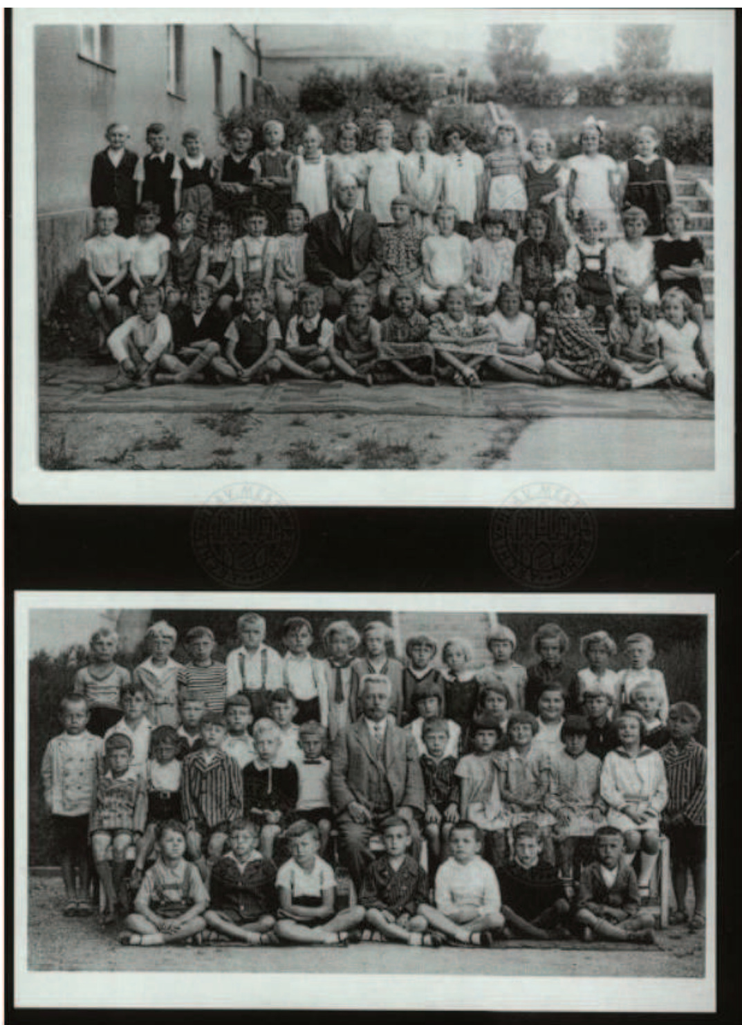
Obr. 9 Foto žáků a učitelů – školní rok 1934/1935