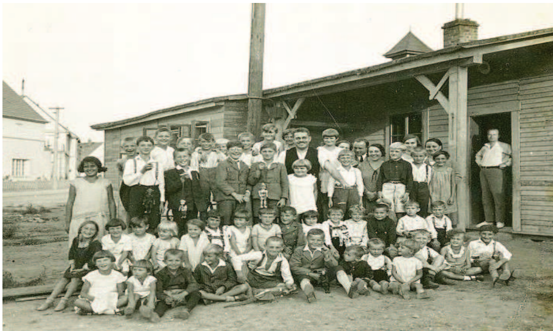
Obr. 1 Návštěvníci loutkového divadla před ještě dřevěnou sokolovnou v roce 1929

Rovněž provozování kina bylo významným zdrojem financí na umořování dluhu. První představení se konalo 1. 9. 1935 filmem Srdce za písničku od Karla Hašlera a potom se pravidelně hrálo o sobotách a nedělích. Ve staré sokolovně se pak hrálo divadlo, především loutkové.