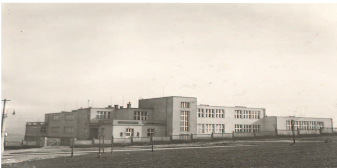
Obr. 10 Pohled na školu s přístavkem