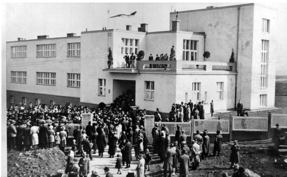
Obr. 7 Slavnostní otevření nové školní budovy ze 13. září roku 1931