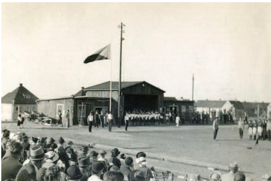
Obr. 3 Den žactva v květnu 1938 na letním cvičišti (provizorní stavby)