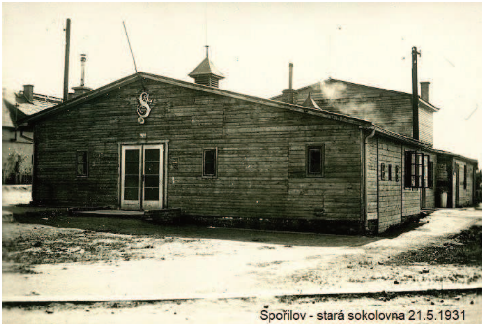
Obr. 2 Spořilov-stará sokolovna 21. 5. 1931

V roce 1933 stoupl počet členů Sokola na 349. Dosavadní dřevěná sokolovna pomalu přestávala stačit. Zároveň také nebylo možné v ní vybudovat biograf. Postupně se tedy začalo uvažovat o vybudování zcela nové zděné sokolovny. Byl zvolen kompromis, kdy se k původní dřevěné sokolovně přistavila zděná část. Tato realizace pak byla doplněna ještě o přístavbu bytu určeného pro sokolníka. Bylo tak možné využívat obě budovy současně.