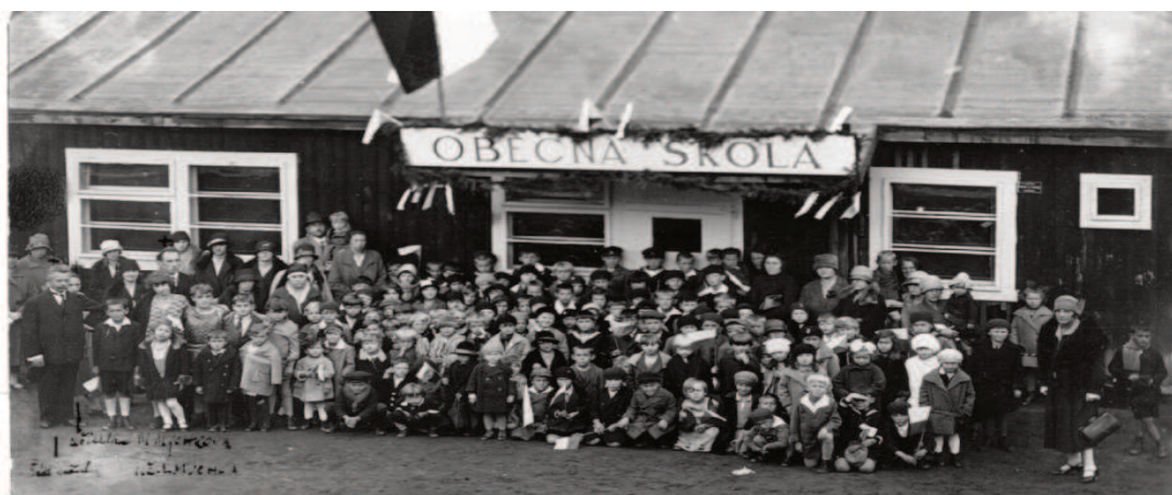
Obr. 5 Otevření školy 1. 9. 1928 – Provizorní školní budova

Ve školách obecných se dělily vyučovací předměty na povinné a nepovinné, na které se žáci mohli dobrovolně přihlásit. Mezi povinné předměty patřily: náboženství (možnost osvobození pro žáky bez vyznání nebo vyznání státem neuznaného), občanská nauka a výchova, jazyk vyučovací, prvouka, věcné nauky – vlastivěda, zeměpis, dějepis, přírodopis a přírodopyt, počty s naukou o tvarech měříčských, kreslení, psaní, zpěv, tělesná výchova, ruční práce chlapecké a ruční práce dívčí s naukou o domácím hospodářství. Mezi nepovinné předměty patřily: druhý jazyk (na školách německých, polských a maďarských jazyk český nebo slovenský), polní hospodářství, hudba, těsnopis a strojopis. 39