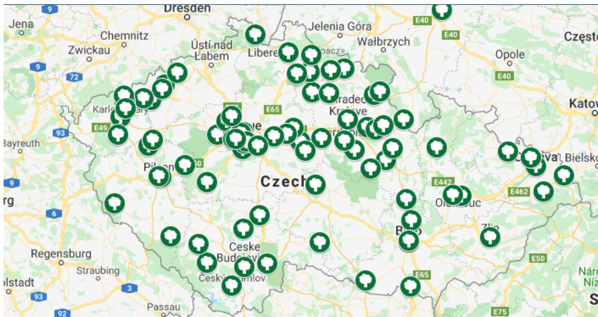
Stromy Olgy Havlové [online]. [cit. 2019-10-31]. Dostupné z: http://www.vdv.cz/projekty/rok-olgy-havlove/

jenom jsme chtěli „listnáče“. Dokonce to došlo tak daleko, že se o tom dozvěděly naše sesterské organizace nebo naši partneři v zahraničí, takže jsme sázeli potom ještě tři stromy v Polsku a jeden ve švýcarské Ženevě.