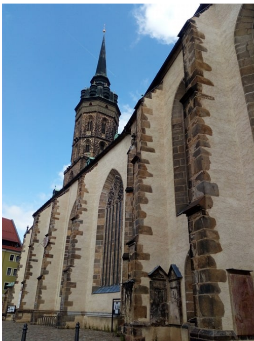
Kolegiální kapitula v Budyšíně