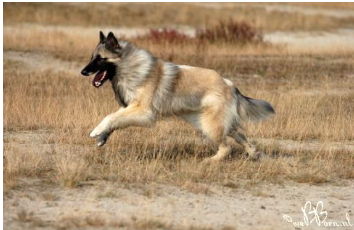
Obr. č. 5 „Belgický ovčák“