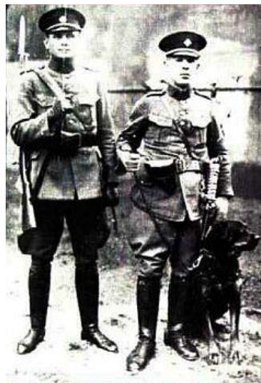
Obr. č. 1 „Vojáci a policejní pes v roce 1920“