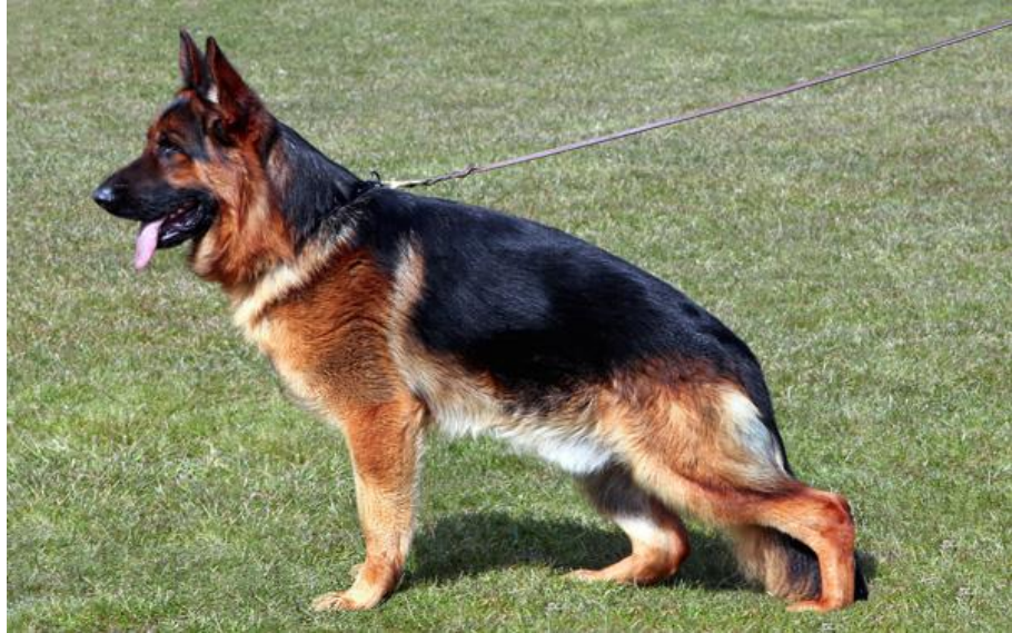
Obr. č. 4 „Německý ovčák“