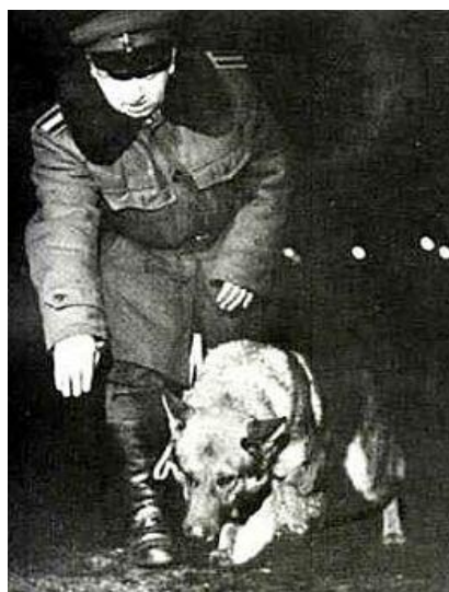
Obr. č. 2 „Příslušník pohraniční policie při práci se služebním psem“