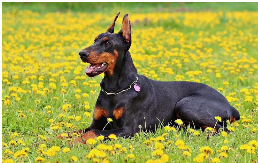
Obr. č. 7 „Dobrman“