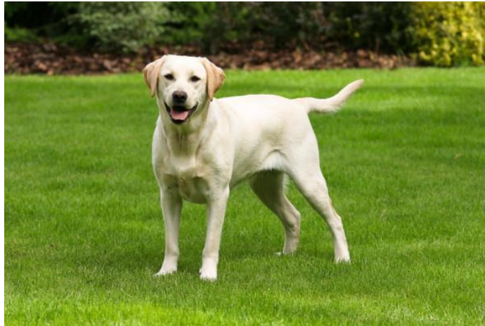
Obr. č. 8 „Labradorský retrívr“