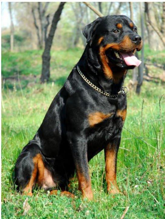
Obr. č. 6 „Rotvajler“