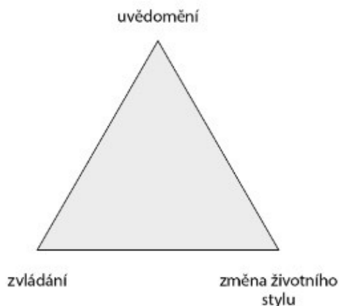
Obrázek 5: Cíle prevence relapsu, zdroj: Wanigaratne, Wallace, Pullin et al., 2008 In Kalina a kol., 2015

Podle Kudy (2008) je prevence relapsu přístupem, jehož cílem je dosažení sebekontroly skrze nácvik dovedností zvládání, kognitivní restrukturalizaci a stabilizaci životního stylu. Shoduje se s obecnými cíli relapsu podle Marlatt a Barret (1994), které znázorňuje následující graf.