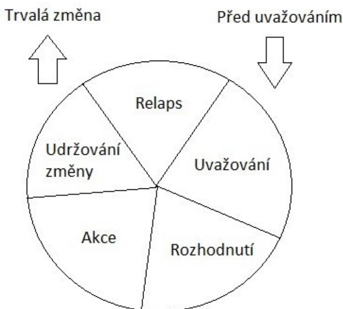
Obrázek 2: Kolo změny dle Procházky a DiClementa

Kalina (2015) podotýká, že klient často projde všemi fázemi (celým kolem změny) několikrát, než se mu podaří dosáhnout trvalé změny. Je tedy na místě klienta na relaps připravit – zajistit, aby klienta co nejméně poškodil. To však neznamená, že relaps předpovídáme nebo povolujeme.