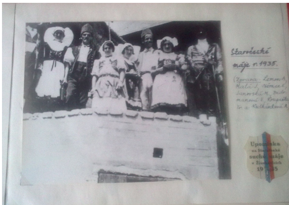
Staročeské máje 1935