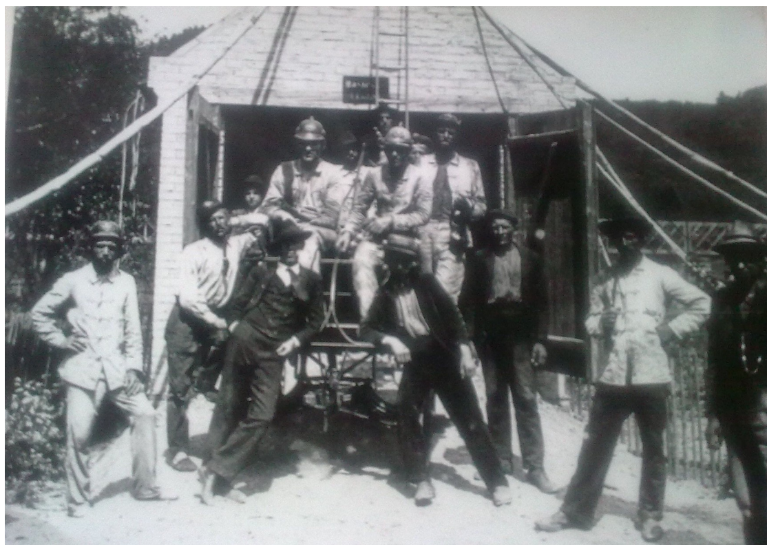
Po cvičení hasičů v roce 1913 před zbrojnicí