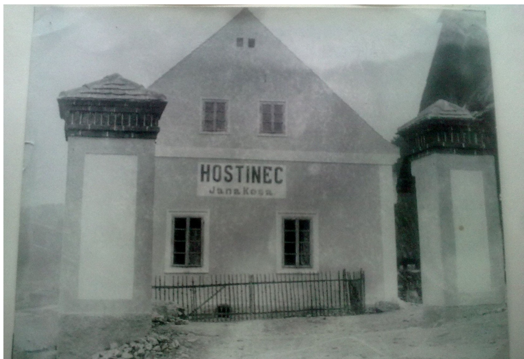
Hostinec „U Kosů“ v roce 1910