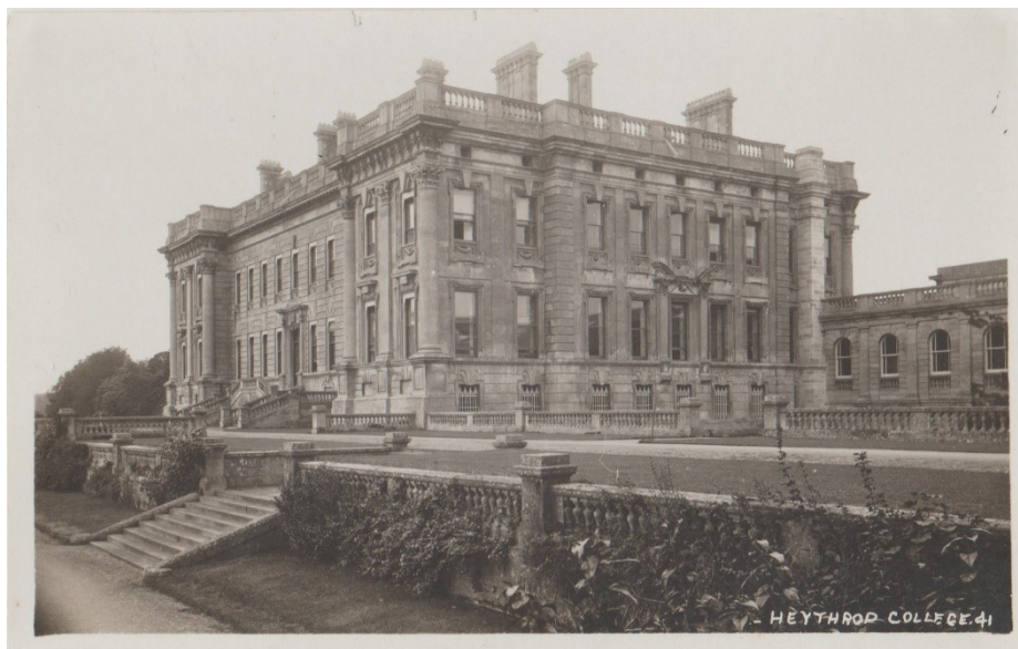
Fotografie 3: Heythrop College.