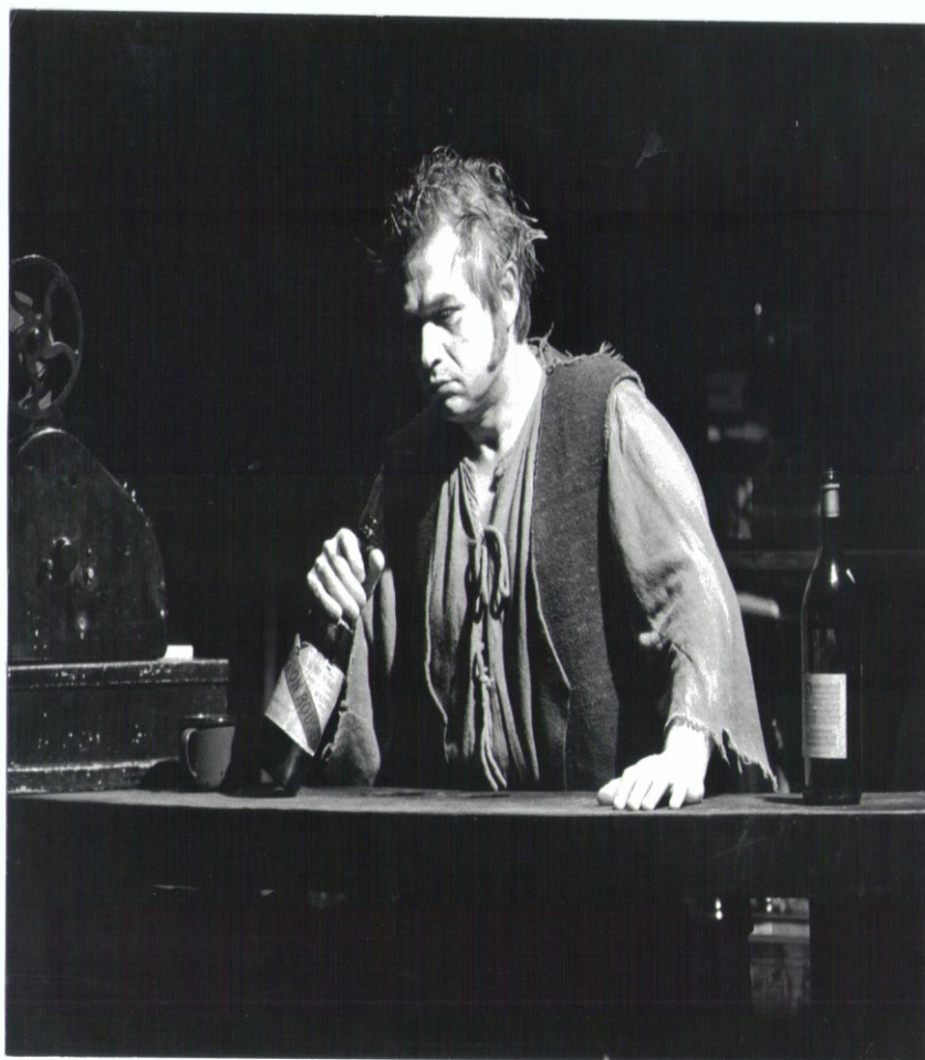
Obr. č. 1-3 z představení Fidelio, role Florestan