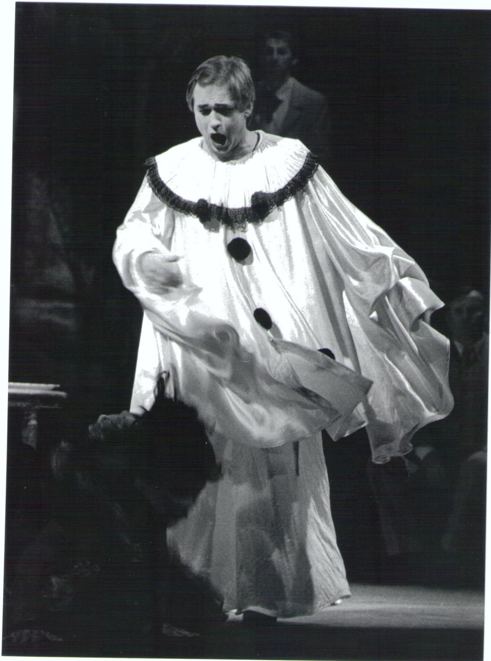
Obr. č. 5 z představení Komedianti, role Canio