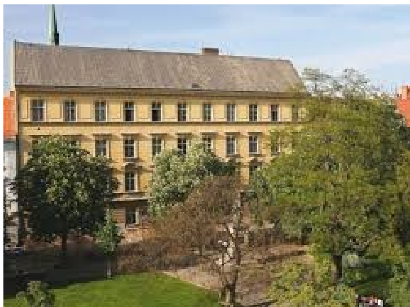
Dnešní podoba školy 126