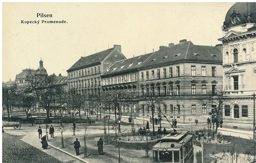
Fotografie Kopeckého sadů – plzeňská konzervatoř se nachází uprostřed dvou budov 125