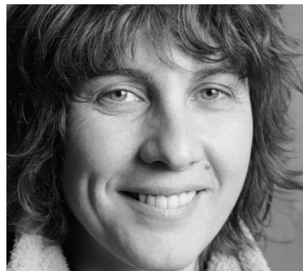
Obrázek 2: Catherine Destivelle

Catherine Destivelle se do povědomí v lezeckém světě dostala v roce 1985, kdy vyhrála první mezinárodní lezecké závody Sportroccia v Bardonecchii. V lezení na obtížnost ovládla závod tři ročníky po sobě, jejími soupeřkami byly Američanka Lynn Hill a Francouzka Isabelle Patissier. V mužské kategorii tehdy zpravidla vítězil Patrick Edlinger, taktéž z Francie.