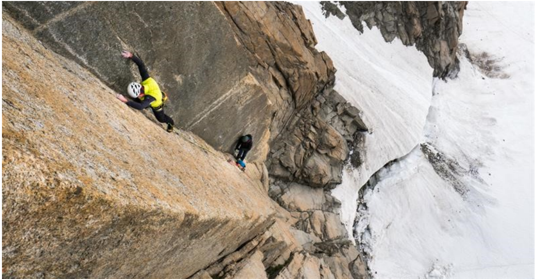
Příloha 5: Chamonix