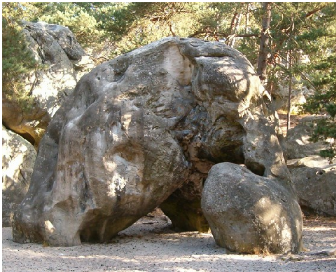
Příloha 3: Fontainebleau