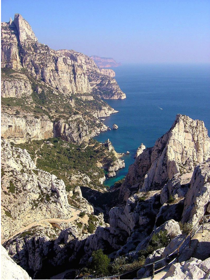
Příloha 2: Les Calanques