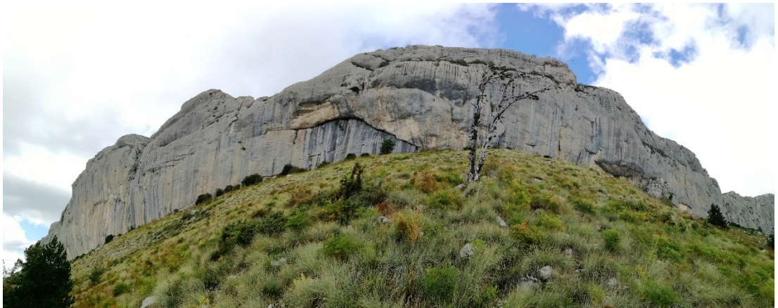
Příloha 6: Ceuse