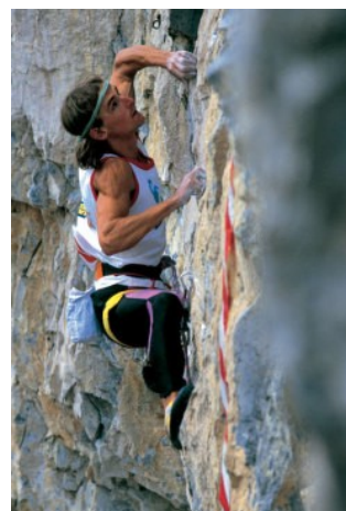
Obrázek 3: Patrick Edlinger

Patrick Edlinger se výrazně podílel na zpopularizování lezení. Ve snímcích, “Lavie aux bout des doigts” (v překladu život na konečkách prstů ) i ve snímku “Opera Verticale” zachycuje převážně sebe, jak leze po skalách. Mladý, polonahý svalnatý muž s šátkem a dlouhými vlasy ohromuje svou silou a odvahou. V dokumentech vysvětluje, v čem lezení spočívá a na co je třeba se soustředit. „Při lezení solo je potřeba superkoncentrace. Leze se bez jakýchkoliv jistících pomůcek, bez lana. Já lezu často nad vodou, to nic neriskuješ, spadneš do vody, nic se nestane. Můžeš tak jít až na svou hranici, zkoušet, co ještě zvládneš.