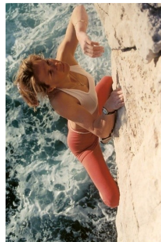
Obrázek 6: Isabelle Patissier

Tato francouzská lezkyně se narodila v roce 1967. S lezením začala v pěti letech pod vedením rodičů. O deset let později se podívala do Chamonix. Až do roku 1986 se věnovala i alpskému lyžování, ale po tomto zlomovém roce, kdy se na prvních závodech na umělé stěně ve Vaulx-en-Velin umístila na prvním místě, zaměřila veškerou svoji pozornost na lezení. Čtyřikrát se umístila na závodech francouzského poháru a dvakrát na světovém šampionátu v letech 1990 a 1991, kde získala bronz i stříbro. Již v jednadvaceti letech vylezla jako první žena cestu obtížnosti 8b. Od sportovního lezení se později přeorientovala na automobilové závody. Dokonce se zúčastnila Rallye Dakar.