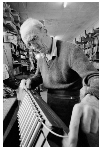
Obrázek 5: Pierre Allain

Pierre Allain je považován za jednoho z nejvýkonnějších a nejvlivnějších lezců dvacátého století ve Francii. Narodil se v roce 1904 ve Vídni, odkud se následně přestěhoval s rodiči do Paříže. Svou lezeckou kariéru odstartoval ve dvacátých letech v Alpách. Až poté objevil Fontainebleau v blízkosti svého domovského města. Velmi brzy se stal součástí GDB – Groupe de Bleau, takzvaných Bleusards. Patřil k nejlepším lezcům své doby. Jako první zvládl v roce 1934 vylézt boulder s klasifikací 5c ve Fontainebleau, který se nachází v sektoru Cuvier Rempart a nese název po svém prvopřeleziteli L’angle Allain.