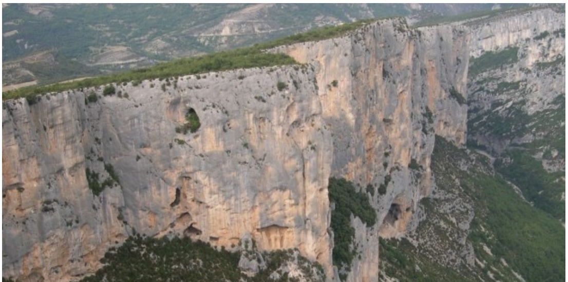
Příloha 7: Verdon